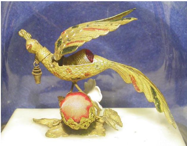
Riikinkukko – messinkiä – viktoriaaniselta ajalta Englannista

Tarjoamme ryhmille pienen sormustimen historialla höystetyn kierroksen saksaksi, joka ulottuu neandertalin ajoista alkaen nykypäivään. Olkaa hyvä ja tiedustelkaa!