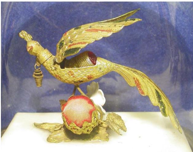
Pauw van messing – Engeland, Victoriaans