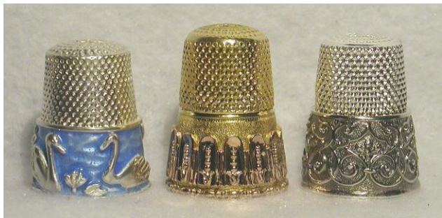
Ontwerper: Thorvald Greif

Voorkant: vingerhoed van emaille - overtrokken met goud - fam. Greif