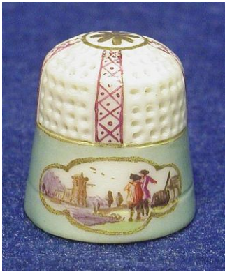
Porselein van Meissen – 1740