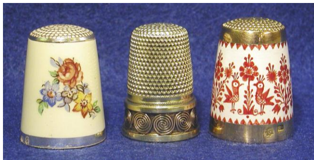
De la fabricación de Helmut Greif

Ese conocimiento forma la base para el museo del dedal en Creglingen que quiere también honrar a los confeccionadores que se esforzaron a proteger las manos de las mujeres de pinchazos con invenciones sutiles y con todas sus ganas. Hoy en día la familia Greif continua con el mester de la fabricación de dedales en su taller de orfebrería y confecciona dedales en series pequeñas, como por ejemplo piezas de colección o modelos únicos y especiales según la tradición artesanal.