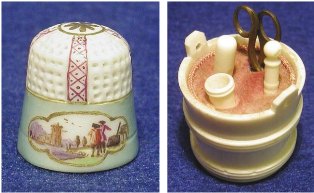
porcelana de Meißner 174 - neceser de costura para niños

El museo demuestra dedales y utensilios de costura de todo el mundo y de todas las épocas en una manera muy extraordinaria y gráfica. Exhibe de objetos de uso sencillos a obras artesanales sofisticadas y muy valiosas de todas las formas y materiales distintos.