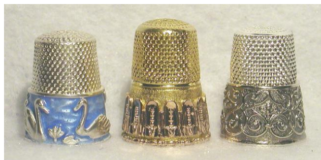
De la fabricación de Thorvald Greif

En la portada: dedal dorado de esmalte de la fabricación Greif