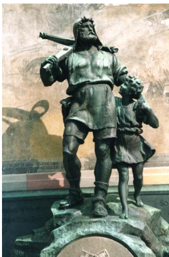
Denkmal in Altdorf

doch wegen eines zweiten Pfeils sollte Tell in Küsnacht eingekerkert werden. Es gelang die Flucht bei der Überfahrt über den Vierwaldstätter See. Tell gelang es später, Gessler aus einem Hinterhalt, „in der hohlen Gasse“ zu töten.